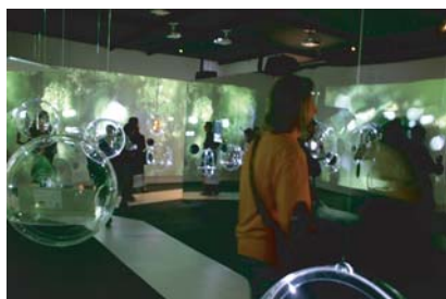
FIAC Luxe!, installation scénographique