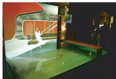
Hz0, installation interactive